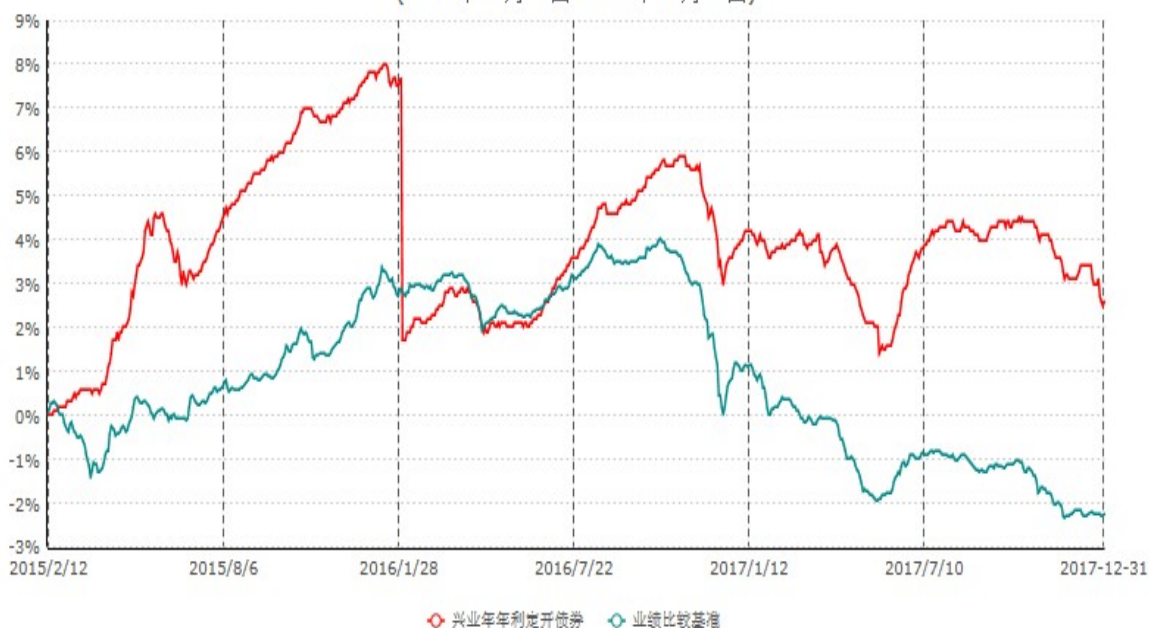
兴业年年利定期开放债券型证券投资基金累计净值增长率与业绩比较基准收益率历史走势对比图 (2015年02月12日-2017年12月31日)