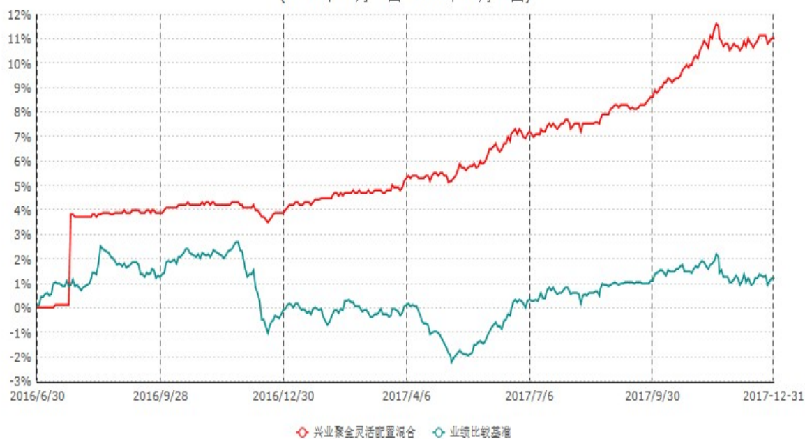
兴业聚全灵活配置混合型证券投资基金累计净值增长率与业绩比较基准收益率历史走势对比图 (2016年06月30日-2017年12月31日)

注：本基金基金合同于2016年6月30日生效，根据本基金基金合同规定，本基金自基金合同生效之日起六个月内已使基金的投资组合比例符合基金合同的约定。