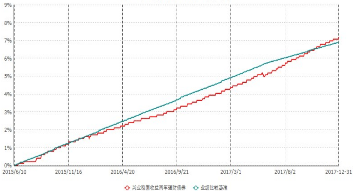
兴业稳固收益两年理财债券型证券投资基金累计净值增长率与业绩比较基准收益率历史走势对比图 (2015年06月10日-2017年12月31日)