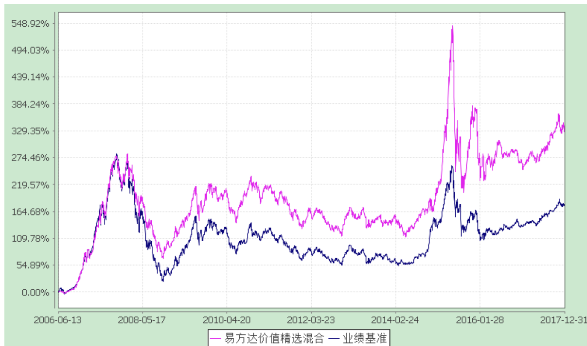
易方达价值精选混合型证券投资基金 份额累计净值增长率与业绩比较基准收益率历史走势对比图 (2006年6月13日至2017年12月31日)

注：自基金合同生效至报告期末，基金份额净值增长率为 334.39%，同期业绩比较基准收益率为 177.84%。