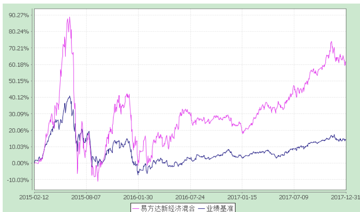
易方达新经济灵活配置混合型证券投资基金 份额累计净值增长率与业绩比较基准收益率历史走势对比图 (2015 年 2 月 12 日至 2017 年 12 月 31 日)

注：自基金合同生效至报告期末，基金份额净值增长率为 61.70%，同期业绩比较基准收益率为 14.45%。