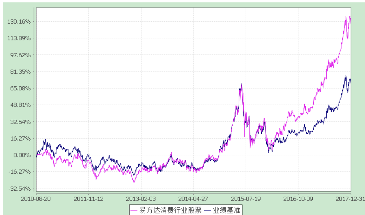
易方达消费行业股票型证券投资基金 份额累计净值增长率与业绩比较基准收益率历史走势对比图 (2010年8月20日至2017年12月31日)

注：自基金合同生效至报告期末，基金份额净值增长率为 133.10%，同期业绩比较基准收益率为 73.33%。