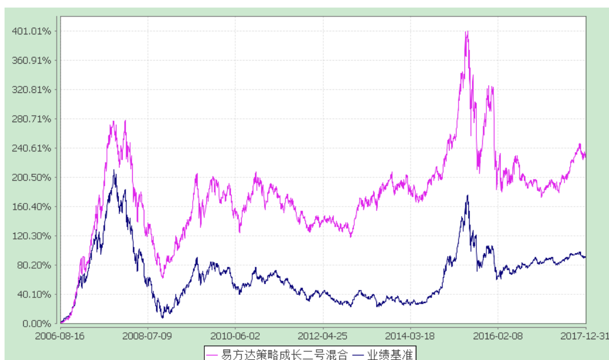
易方达策略成长二号混合型证券投资基金 份额累计净值增长率与业绩比较基准收益率历史走势对比图 (2006年8月16日至2017年12月31日)

注：自基金合同生效至报告期末，基金份额净值增长率为 231.05%，同期业绩比较基准收益率为 91.44%。