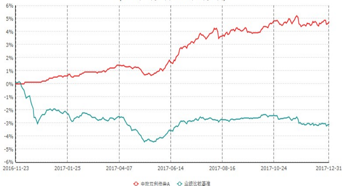
中欧双利债券A累计净值增长率与业绩比较基准收益率历史走势对比图 (2016年11月23日-2017年12月31日)

注：本基金基金合同生效日期为2016年11月23日，按基金合同的规定，本基金自基金合同生效起六个月为建仓期，建仓期结束时本基金的各项资产配置比例已达到基金合同的规定。