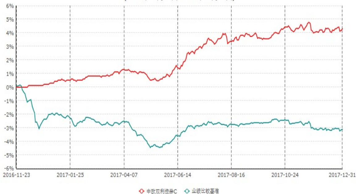
中欧双利债券C累计净值增长率与业绩比较基准收益率历史走势对比图 (2016年11月23日-2017年12月31日)

注：本基金基金合同生效日期为2016年11月23日，按基金合同的规定，本基金自基金合同生效起六个月为建仓期，建仓期结束时本基金的各项资产配置比例已达到基金合同的规定。