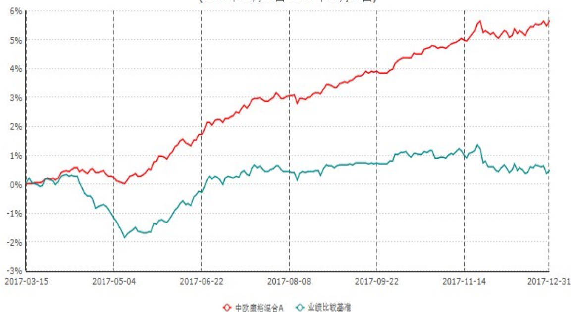
中欧康裕混合A累计净值增长率与业绩比较基准收益率历史走势对比图 (2017年03月15日-2017年12月31日)

注：本基金基金合同生效日期为 2017 年 3 月 15 日，自基金合同生效日起到本报告期末不满一年，按基金合同的规定，本基金自基金合同生效起六个月为建仓期，建仓期结束时本基金的各项资产配置比例已达到基金合同的规定