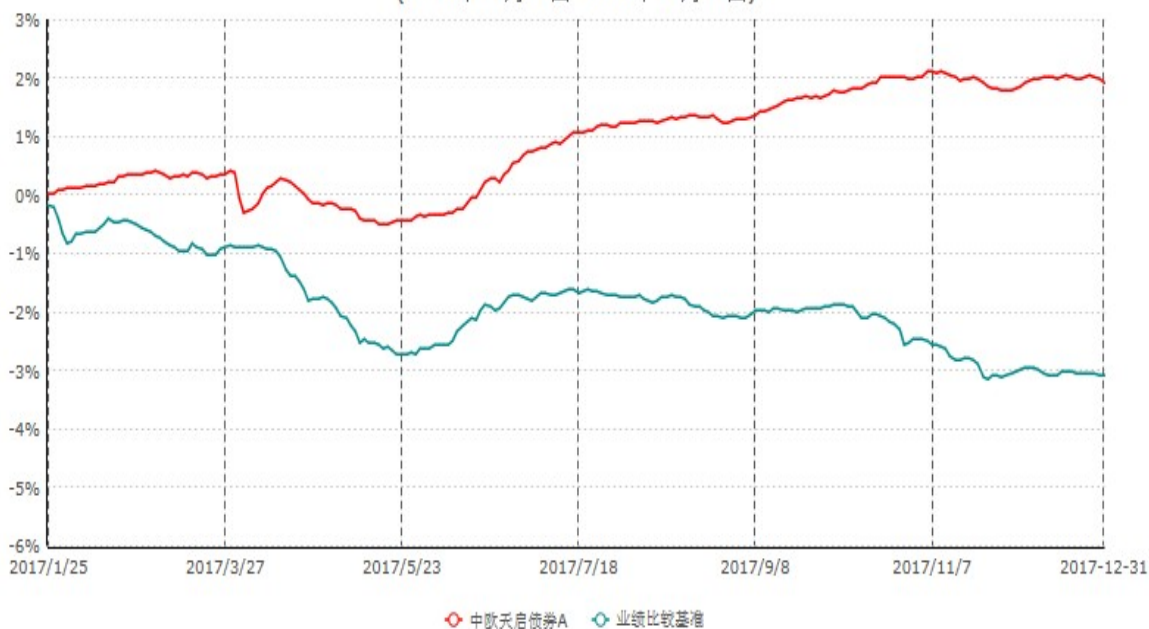
中欧天启债券A累计净值增长率与业绩比较基准收益率历史走势对比图 (2017年01月25日-2017年12月31日)

注：本基金基金合同生效日期为 2017 年 1 月 25 日，自基金合同生效日起到本报告期末不满一年，按基金合同的规定，本基金自基金合同生效起六个月为建仓期，建仓期结束时本基金的各项资产配置比例已达到基金合同的规定。