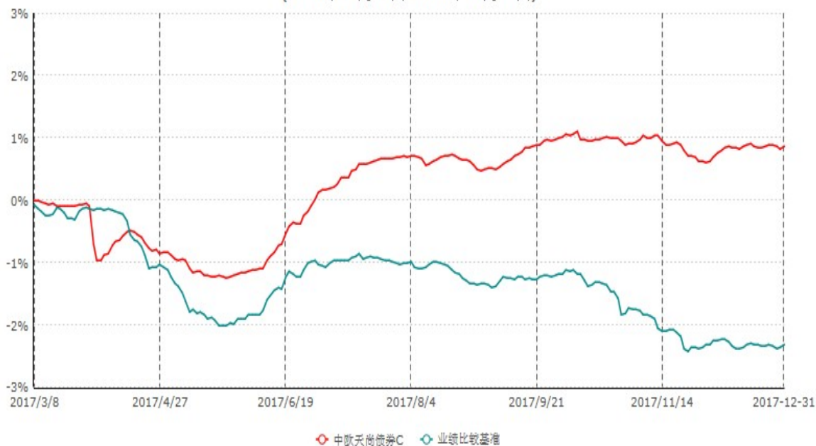
中欧天尚债券C累计净值增长率与业绩比较基准收益率历史走势对比图 (2017年03月08日-2017年12月31日)

注：本基金基金合同生效日期为 2017 年 3 月 8 日，自基金合同生效日起到本报告期末不满一年，按基金合同的规定，本基金自基金合同生效起六个月为建仓期，建仓期结束时本基金的各项资产配置比例已达到基金合同的规定