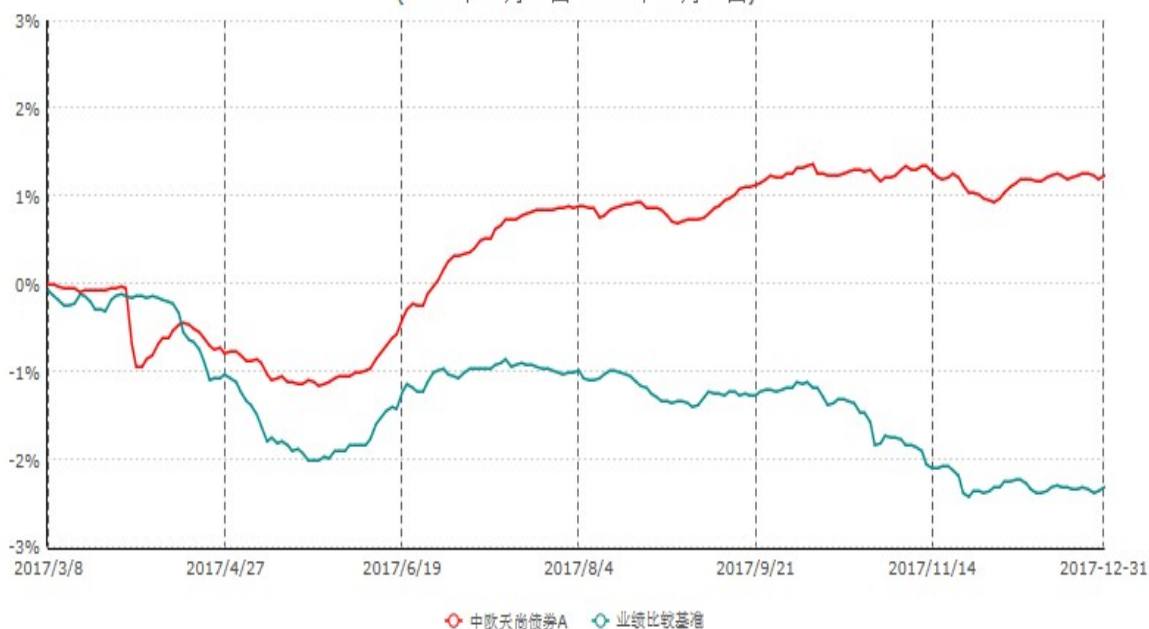
中欧天尚债券A累计净值增长率与业绩比较基准收益率历史走势对比图 (2017年03月08日-2017年12月31日)

注：本基金基金合同生效日期为 2017 年 3 月 8 日，自基金合同生效日起到本报告期末不满一年，按基金合同的规定，本基金自基金合同生效起六个月为建仓期，建仓期结束时本基金的各项资产配置比例已达到基金合同的规定