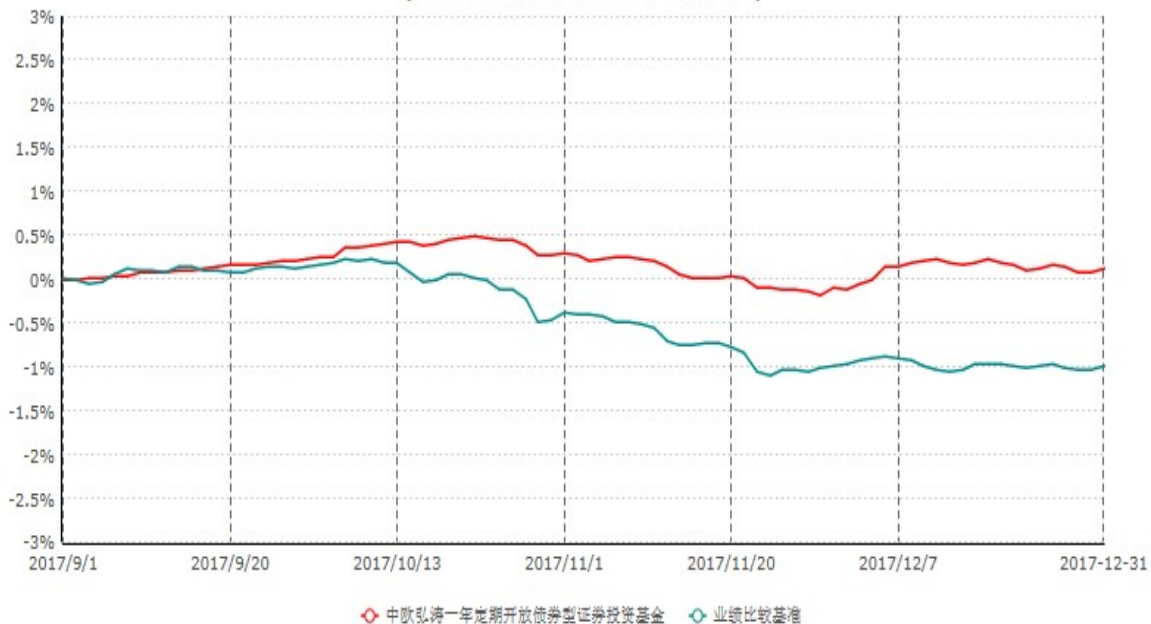
中欧弘涛一年定期开放债券型证券投资基金累计净值增长率与业绩比较基准收益率历史走势对比图 (2017年09月01日-2017年12月31日)

注: 本基金基金合同生效日期为2017年9月1日, 自基金合同生效日起到本报告期末不满一年, 按基金合同的规定, 本基金自基金合同生效起六个月为建仓期, 建仓期结束时本基金的各项资产配置比例应当达到基金合同的规定。