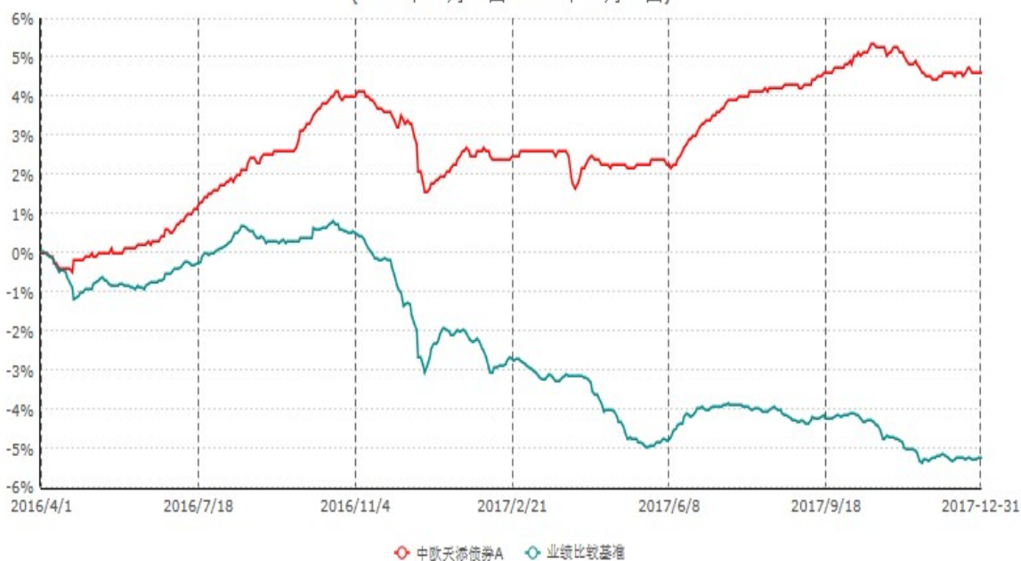
中欧天添债券A累计净值增长率与业绩比较基准收益率历史走势对比图 (2016年04月01日-2017年12月31日)