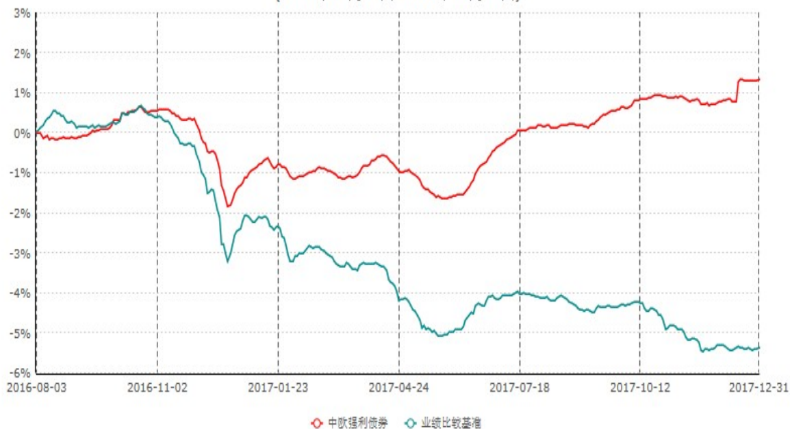
中欧强利债券型证券投资基金累计净值增长率与业绩比较基准收益率历史走势对比图 (2016年08月03日-2017年12月31日)

注：本基金基金合同生效日期为2016年8月3日，按基金合同的规定，本基金自基金合同生效起六个月为建仓期，建仓期结束时本基金的各项资产配置比例已达到基金合同的规定。