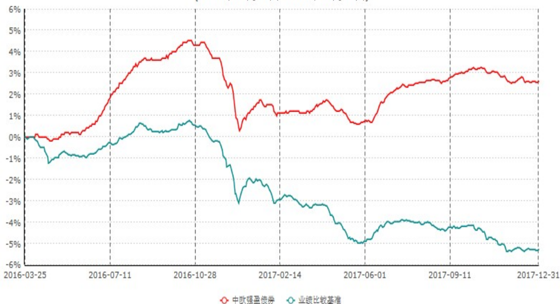
中欧强盈定期开放债券型证券投资基金累计净值增长率与业绩比较基准收益率历史走势对比图 (2016年03月25日-2017年12月31日)