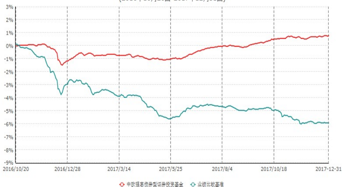
中欧强惠债券型证券投资基金累计净值增长率与业绩比较基准收益率历史走势对比图 (2016年10月20日-2017年12月31日)

注：本基金基金合同生效日期为2016年10月20日，按基金合同的规定，本基金自基金合同生效起六个月为建仓期，建仓期结束时本基金的各项资产配置比例已达到基金合同的规定