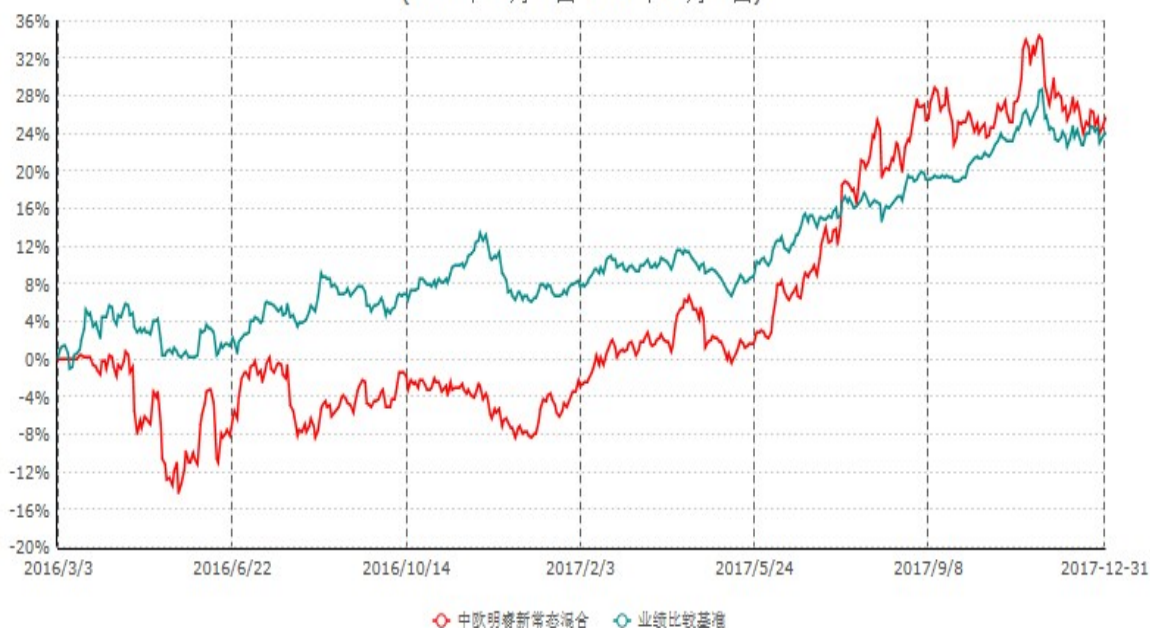
中欧明睿新常态混合型证券投资基金累计净值增长率与业绩比较基准收益率历史走势对比图 (2016年03月03日-2017年12月31日)