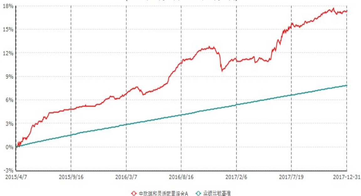
中欧琪和灵活配置混合A累计净值增长率与业绩比较基准收益率历史走势对比图 (2015年04月07日-2017年12月31日)