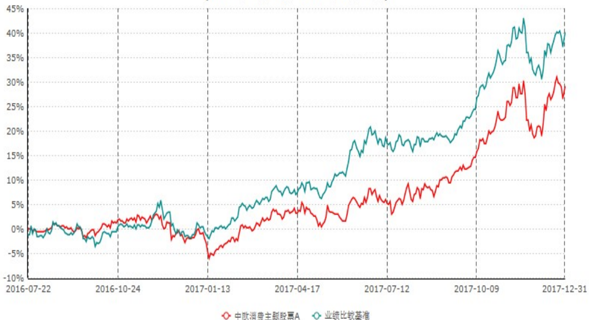
中欧消费主题股票A累计净值增长率与业绩比较基准收益率历史走势对比图 (2016年07月22日-2017年12月31日)