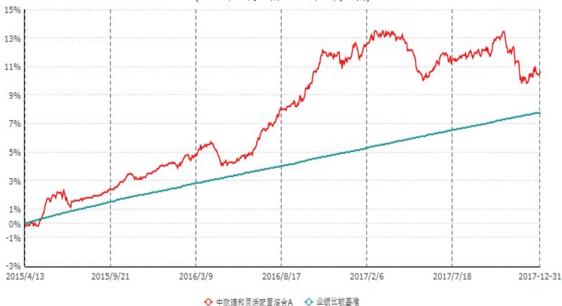
中欧瑾和灵活配置混合A累计净值增长率与业绩比较基准收益率历史走势对比图 (2015年04月13日-2017年12月31日)