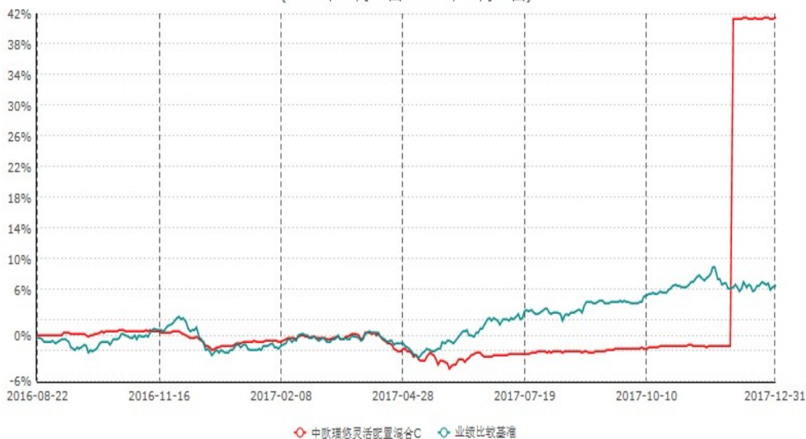
中欧瑾悠灵活配置混合C累计净值增长率与业绩比较基准收益率历史走势对比图 (2016年08月22日-2017年12月31日)

注：本基金基金合同生效日期为 2016 年 8 月 22 日，按基金合同的规定，本基金自基金合同生效起六个月为建仓期，建仓期结束时本基金的各项资产配置比例已达到基金合同的规定