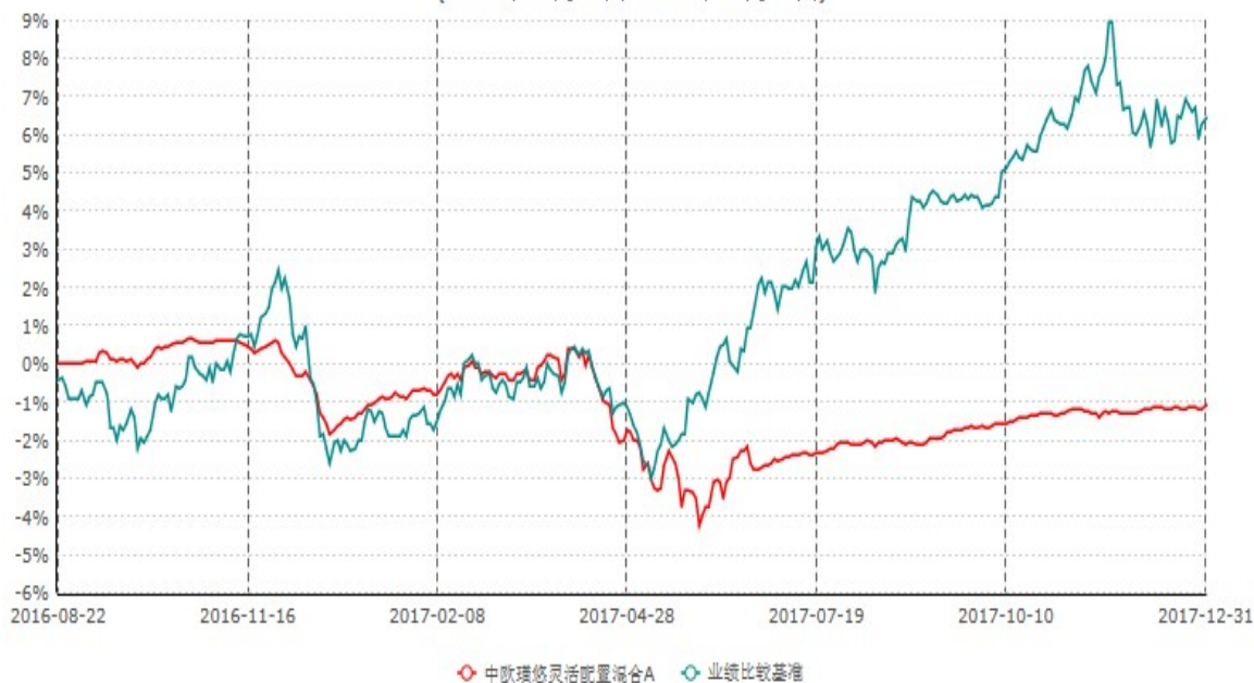
中欧瑾悠灵活配置混合A累计净值增长率与业绩比较基准收益率历史走势对比图 (2016年08月22日-2017年12月31日)

注：本基金基金合同生效日期为 2016 年 8 月 22 日，按基金合同的规定，本基金自基金合同生效起六个月为建仓期，建仓期结束时本基金的各项资产配置比例已达到基金合同的规定