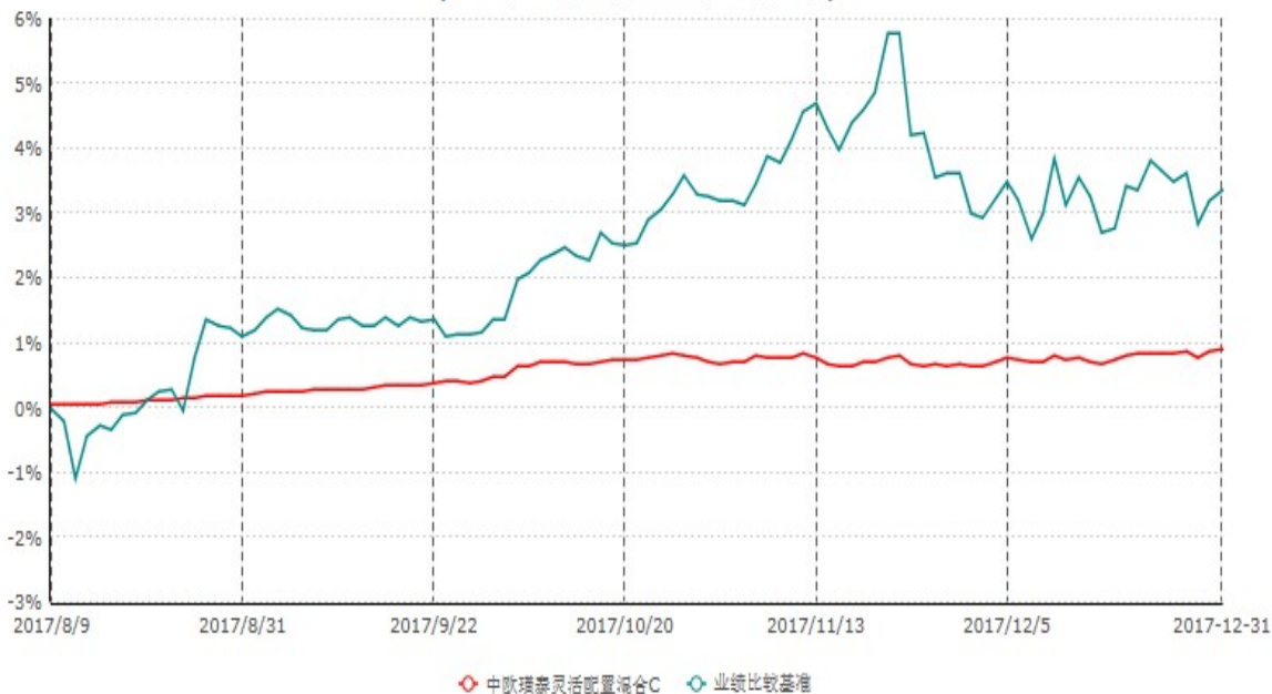
中欧瑾泰灵活配置混合C累计净值增长率与业绩比较基准收益率历史走势对比图 (2017年08月09日-2017年12月31日)

注：本基金基金合同生效日期为2017年8月9日，自基金合同生效日起到本报告期末不满一年，按基金合同的规定，本基金自基金合同生效起六个月为建仓期，建仓期结束时本基金的各项资产配置比例应当符合基金合同的规定