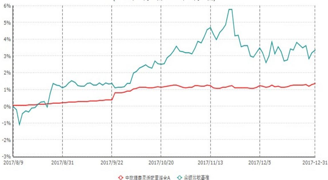
中欧瑾泰灵活配置混合A累计净值增长率与业绩比较基准收益率历史走势对比图 (2017年08月09日-2017年12月31日)

注：本基金基金合同生效日期为2017年8月9日，自基金合同生效日起到本报告期末不满一年，按基金合同的规定，本基金自基金合同生效起六个月为建仓期，建仓期结束时本基金的各项资产配置比例应当符合基金合同的规定