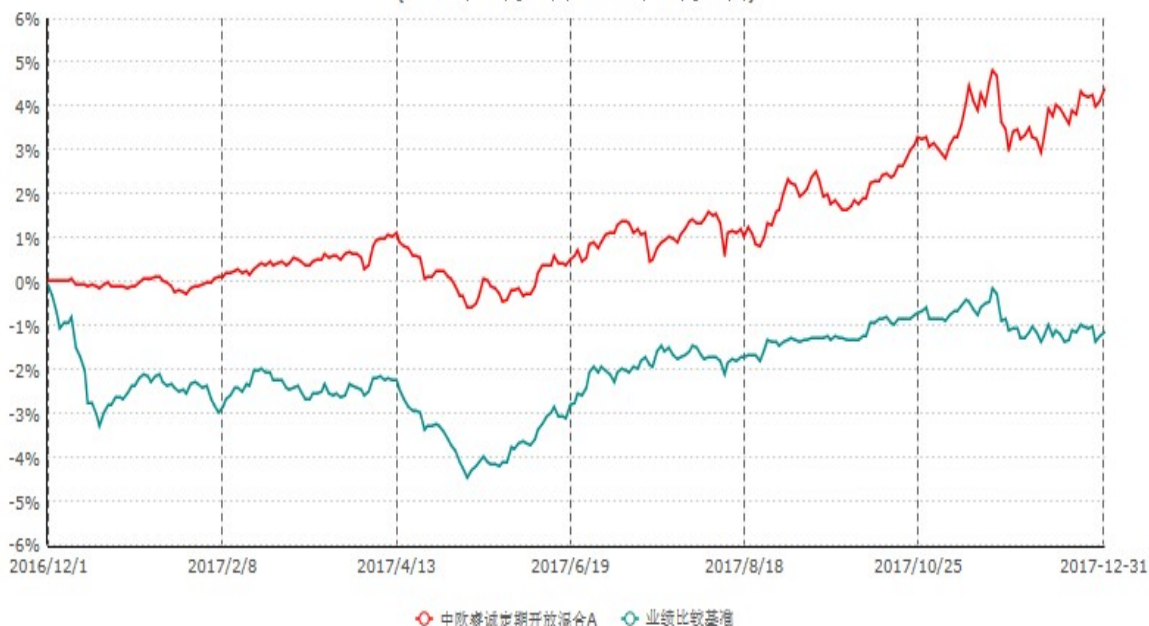
中欧睿诚定期开放混合A累计净值增长率与业绩比较基准收益率历史走势对比图 (2016年12月01日-2017年12月31日)

注：本基金基金合同生效日期为2016年12月1日，按基金合同的规定，本基金自基金合同生效起六个月为建仓期，建仓期结束时本基金的各项资产配置比例已达到基金合同的规定