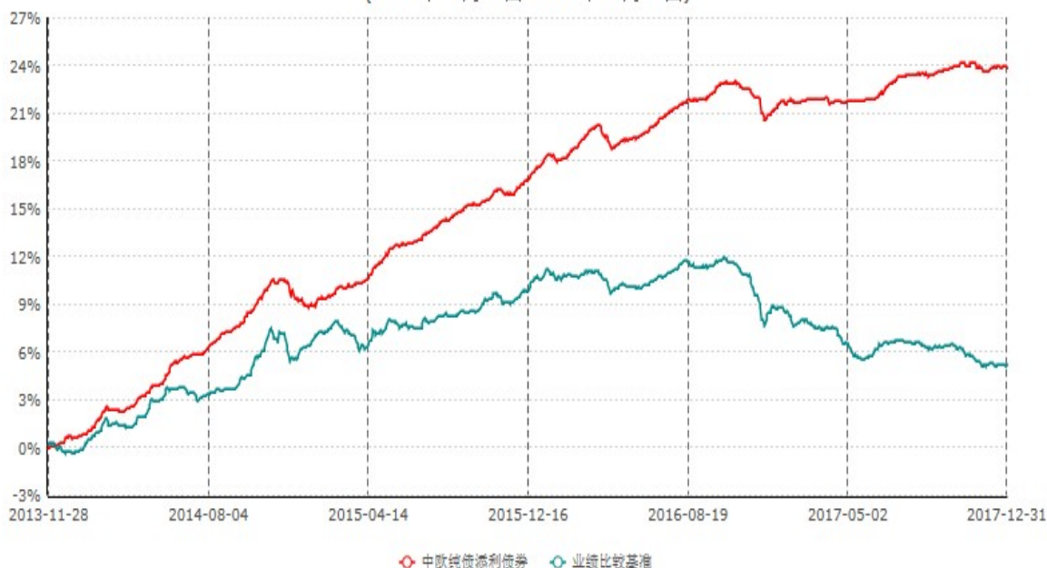
中欧纯债添利分级债券型证券投资基金累计净值增长率与业绩比较基准收益率历史走势对比图 (2013年11月28日-2017年12月31日)