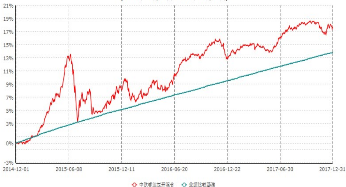
中欧睿达定期开放混合型发起式证券投资基金累计净值增长率与业绩比较基准收益率历史走势对比图 (2014年12月01日-2017年12月31日)