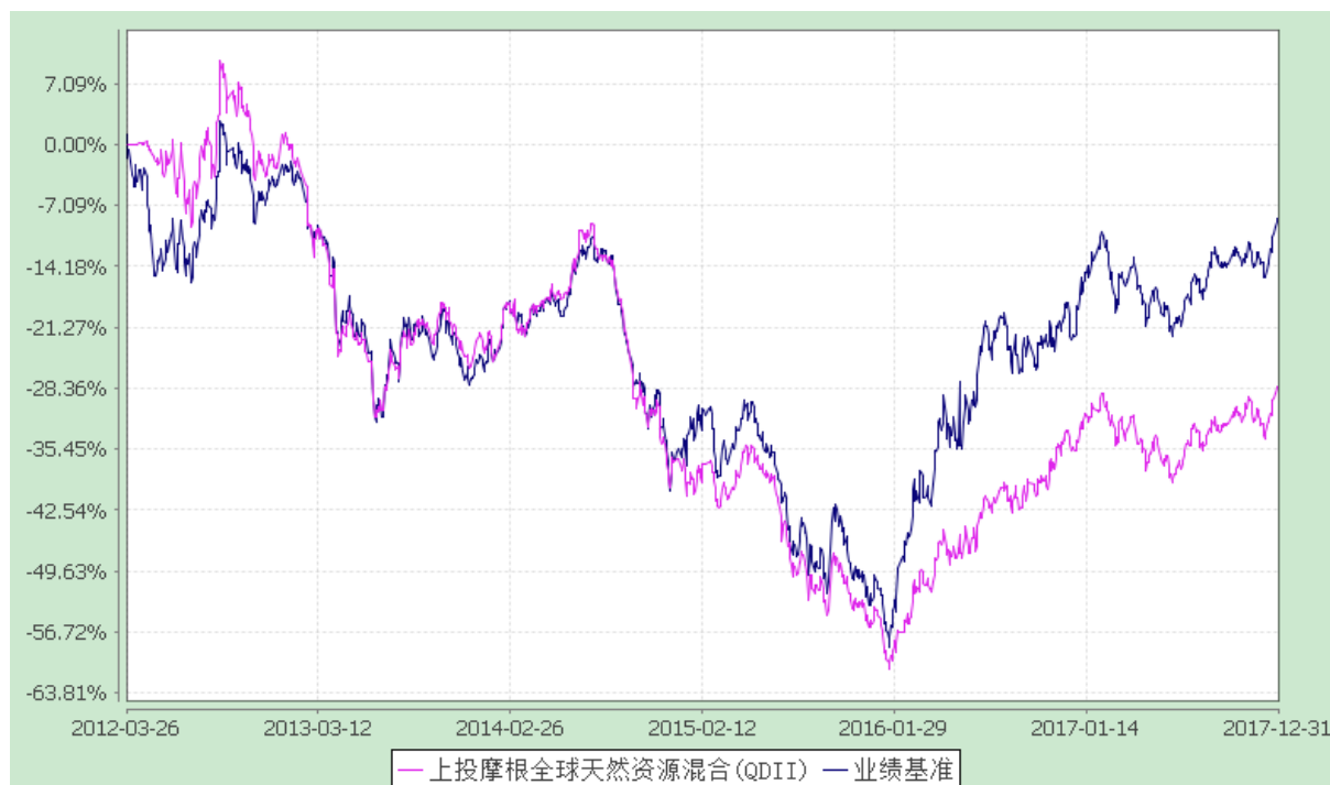
上投摩根全球天然资源混合型证券投资基金 自基金合同生效以来份额累计净值增长率与业绩比较基准收益率历史走势对比图 (2012 年 3 月 26 日至 2017 年 12 月 31 日)

注：本基金合同生效日为 2012 年 3 月 26 日，图示时间段为 2012 年 3 月 26 日至 2017 年 12 月 31 日。