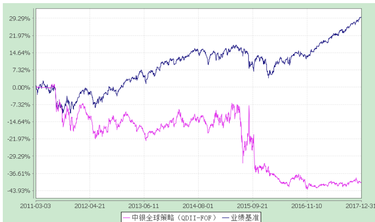
中银全球策略证券投资基金（FOF） 份额累计净值增长率与业绩比较基准收益率历史走势对比图 (2011年3月3日至2017年12月31日)

注：按基金合同规定，本基金自基金合同生效起6个月内为建仓期，截至建仓结束时本基金的各项投资比例已达到基金合同第十二部分（二）的规定，即本基金的基金投资不低于本基金资产的60%，现金和到期日在一年以内的政府债券不低于基金资产净值的5%。