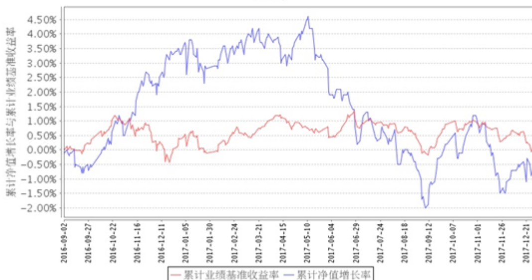
招商信用定开债（QDII）累计净值增长率与同期业绩比较基准收益率的历史走势对比图