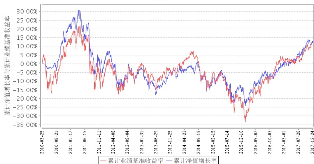
招商全球资源股票(QDII)累计净值增长率与同期业绩比较基准收益率的历史走势对比图