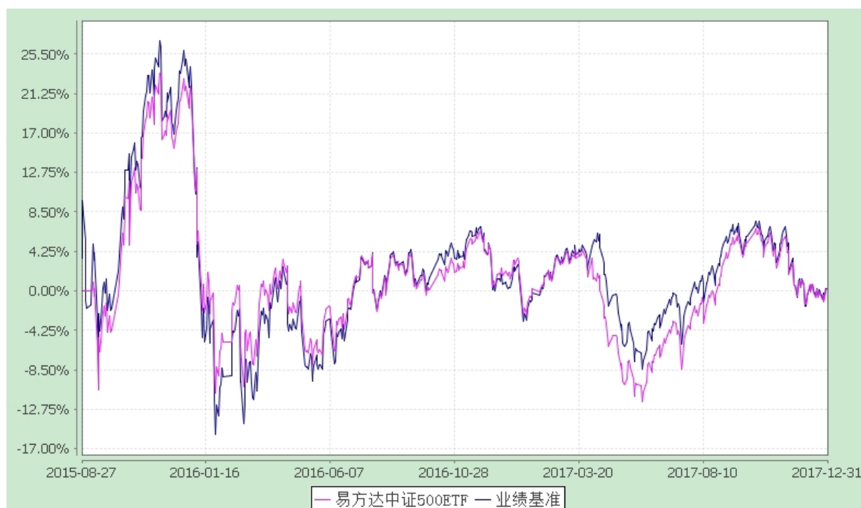
易方达中证 500 交易型开放式指数证券投资基金 份额累计净值增长率与业绩比较基准收益率历史走势对比图 (2015 年 8 月 27 日至 2017 年 12 月 31 日)

注：自基金合同生效至报告期末，基金份额净值增长率为 0.20%，同期业绩比较基准收益率为 0.20%。