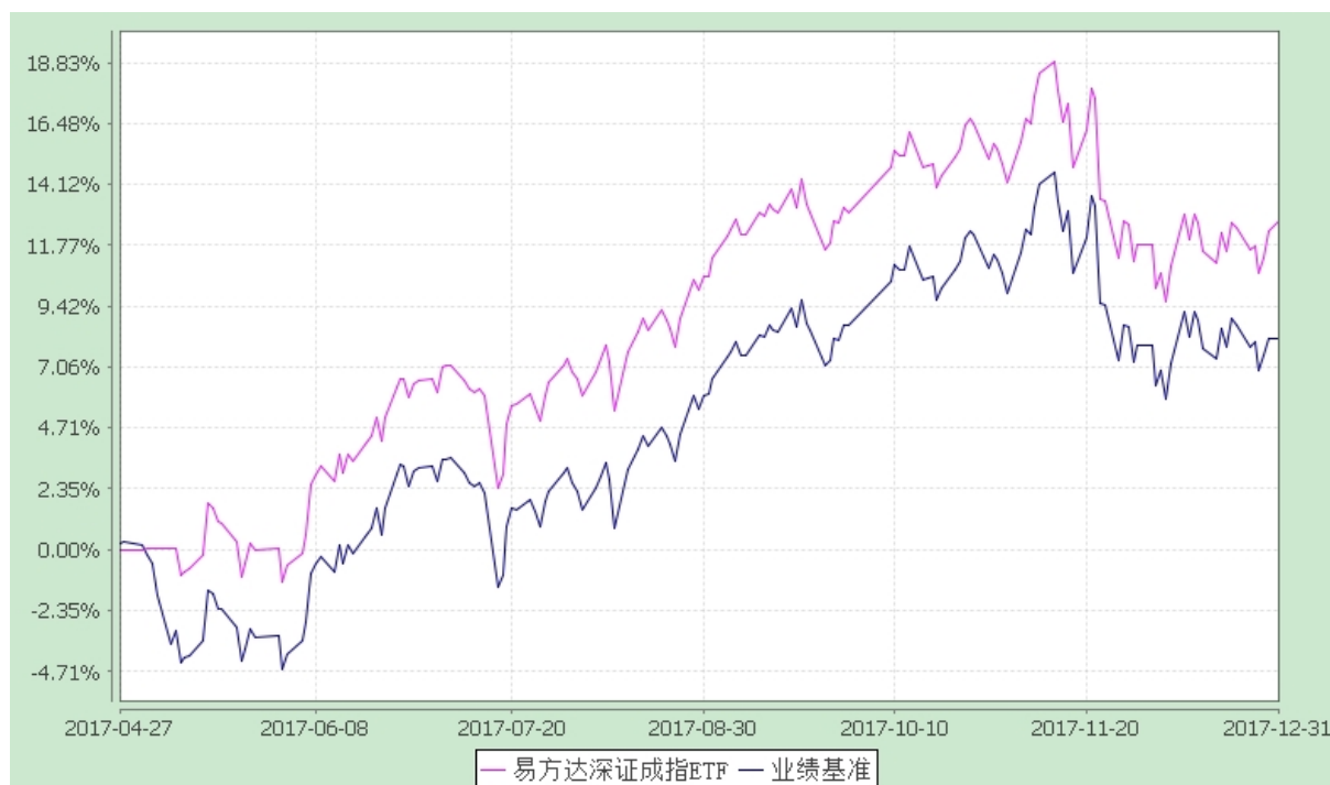
易方达深证成指交易型开放式指数证券投资基金 份额累计净值增长率与业绩比较基准收益率历史走势对比图 (2017 年 4 月 27 日至 2017 年 12 月 31 日)

注：1.本基金合同于 2017 年 4 月 27 日生效，截至报告期末本基金合同生效未满一年。