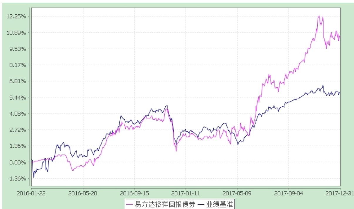
易方达裕祥回报债券型证券投资基金 份额累计净值增长率与业绩比较基准收益率历史走势对比图 (2016 年 1 月 22 日至 2017 年 12 月 31 日)

注：自基金合同生效至报告期末，基金份额净值增长率为 10.60%，同期业绩比较基准收益率为 5.88%。