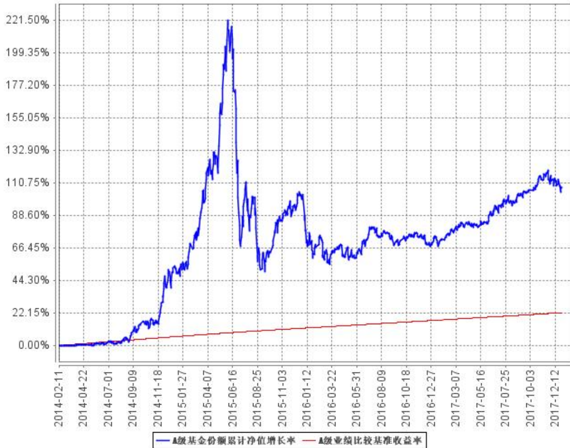
A级基金份额累计净值增长率与同期业绩比较基准收益率的历史走势对比图