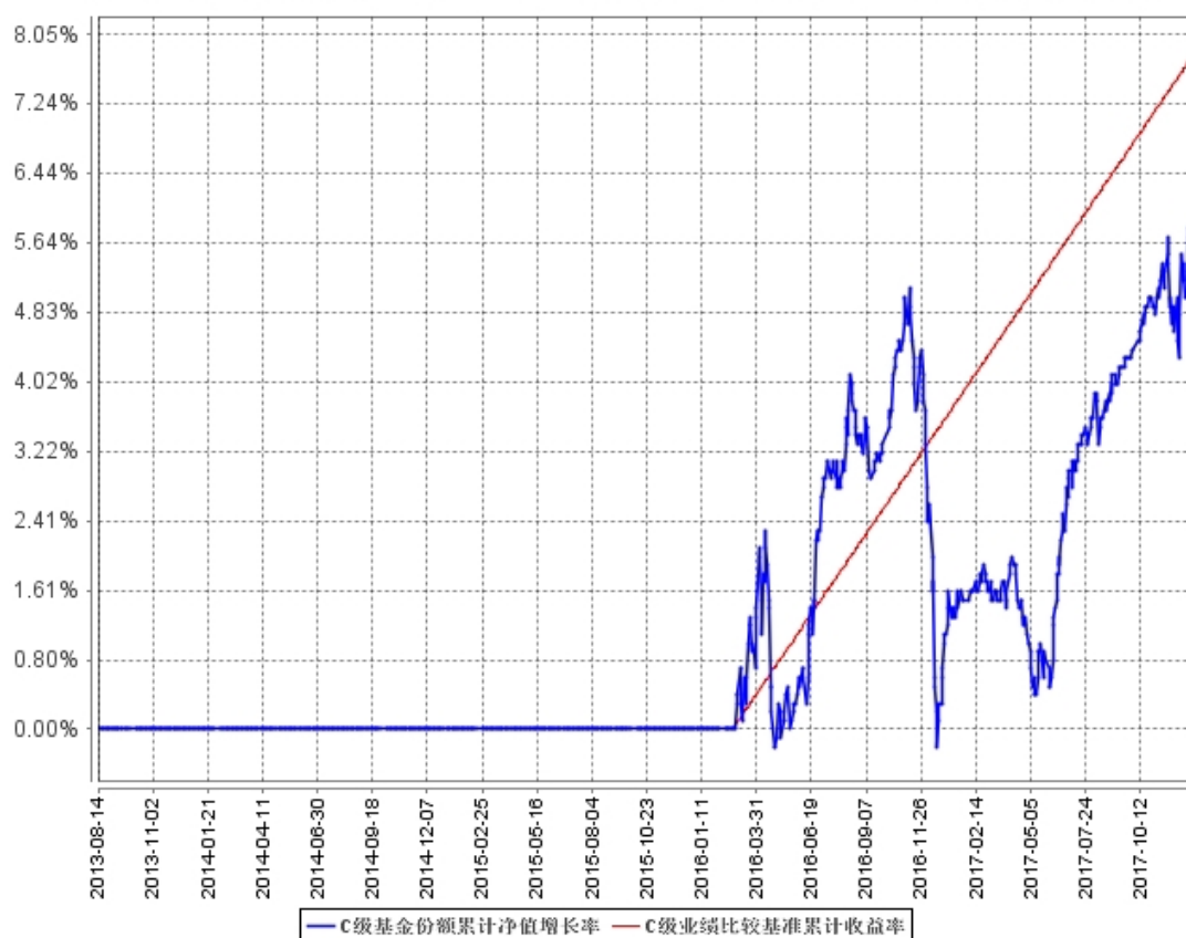
C级基金份额累计净值增长率与同期业绩比较基准收益率的历史走势对比图