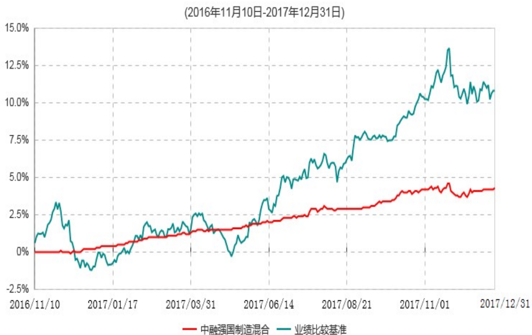
中融强国制造灵活配置混合型证券投资基金累计净值增长率与业绩比较基准收益率历史走势对比图

注：按照基金合同和招募说明书的约定，本基金自合同生效日起6个月内为建仓期，建仓期结束时本基金的各项资产配置比例符合基金合同的有关约定。