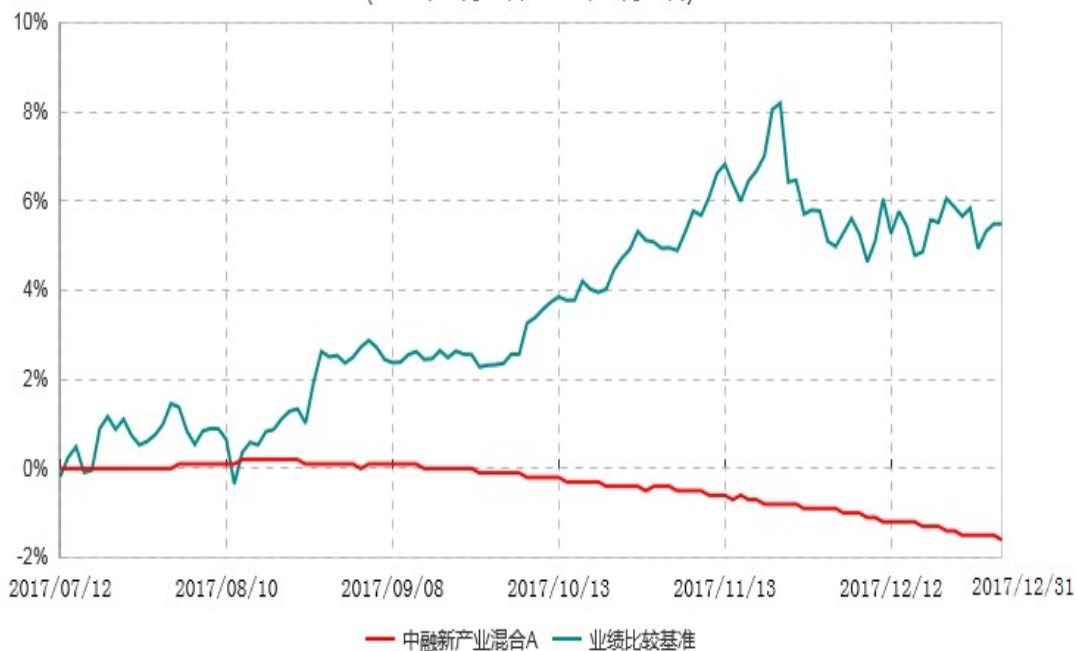
中融新产业混合C累计净值增长率与业绩比较基准收益率历史走势对比图