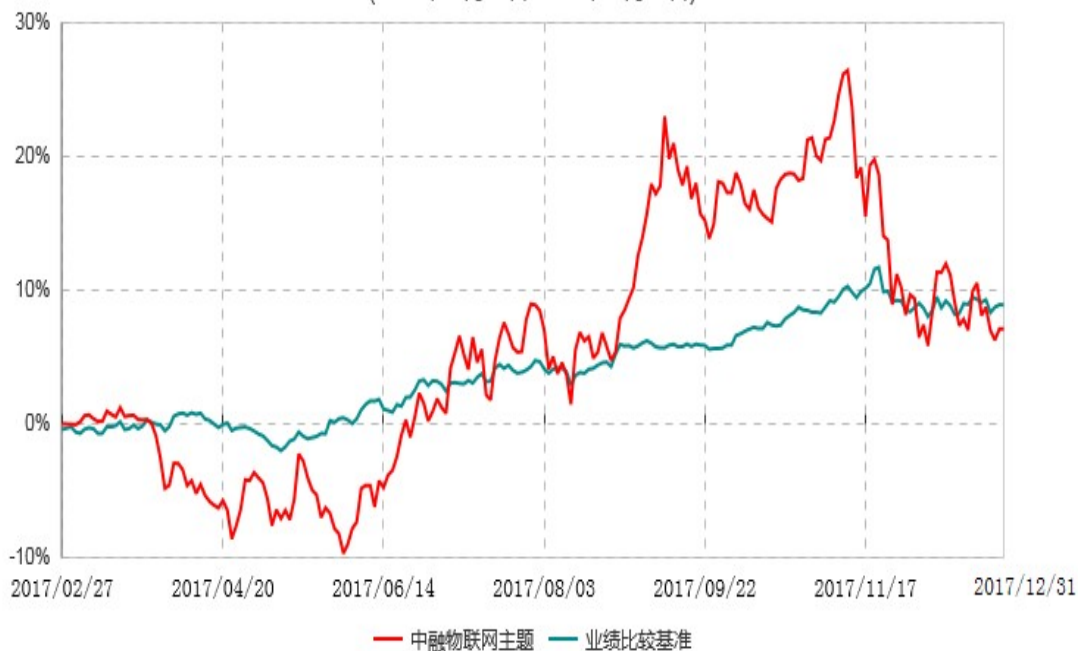
中融物联网主题灵活配置混合型证券投资基金累计净值增长率与业绩比较基准收益率历史走势对比图 (2017年02月27日-2017年12月31日)

注：按照基金合同和招募说明书的约定，本基金自合同生效日起6个月内为建仓期，建仓期结束时本基金的各项资产配置比例符合基金合同的有关约定。