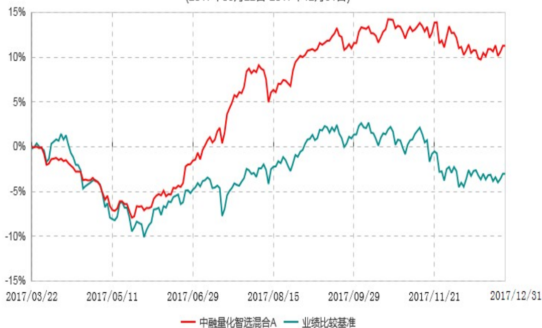
中融量化智选混合C累计净值增长率与业绩比较基准收益率历史走势对比图