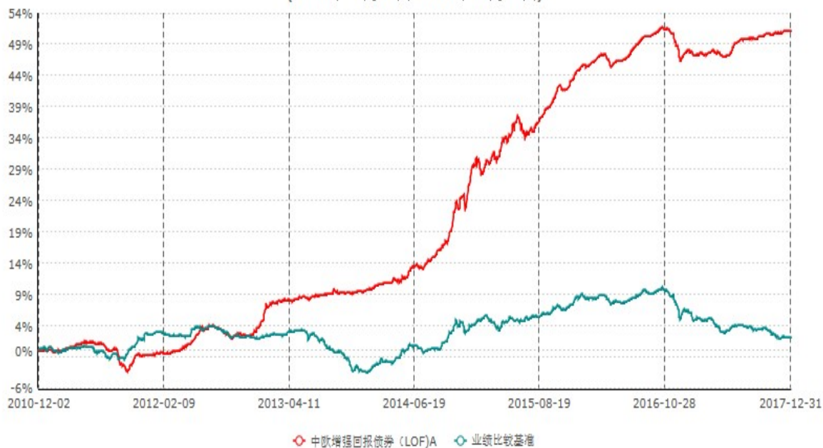
中欧增强回报债券（LOF）A累计净值增长率与业绩比较基准收益率历史走势对比图 (2010年12月02日-2017年12月31日)