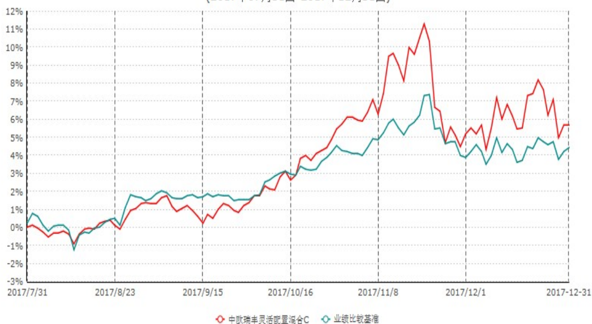
中欧瑞丰灵活配置混合C累计净值增长率与业绩比较基准收益率历史走势对比图 (2017年07月31日-2017年12月31日)

注：本基金合同生效日期为2017年7月31日，自基金合同生效日起到本报告期末不满一年，按基金合同的规定，本基金自基金合同生效起六个月为建仓期，建仓期结束时本基金的各项资产配置比例应当符合基金合同约定。