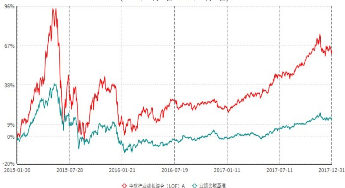
中欧行业成长混合(LOF) A累计净值增长率与业绩比较基准收益率历史走势对比图 (2015年01月30日-2017年12月31日)