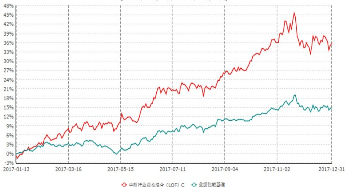
中欧行业成长混合 (LOF) C 累计净值增长率与业绩比较基准收益率历史走势对比图 (2017年01月13日-2017年12月31日)

注：本基金于 2017 年 01 月 12 日新增 C 份额，图示日期为 2017 年 01 月 13 日至 2017 年 12 月 31 日。