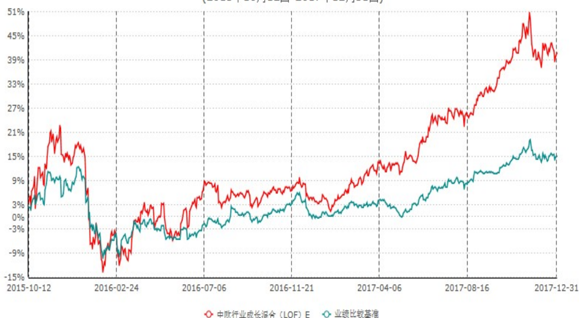
中欧行业成长混合(LOF) E累计净值增长率与业绩比较基准收益率历史走势对比图 (2015年10月12日-2017年12月31日)

注：本基金于2015年10月8日新增E份额，图示日期为2015年10月12日至2017年12月31日。