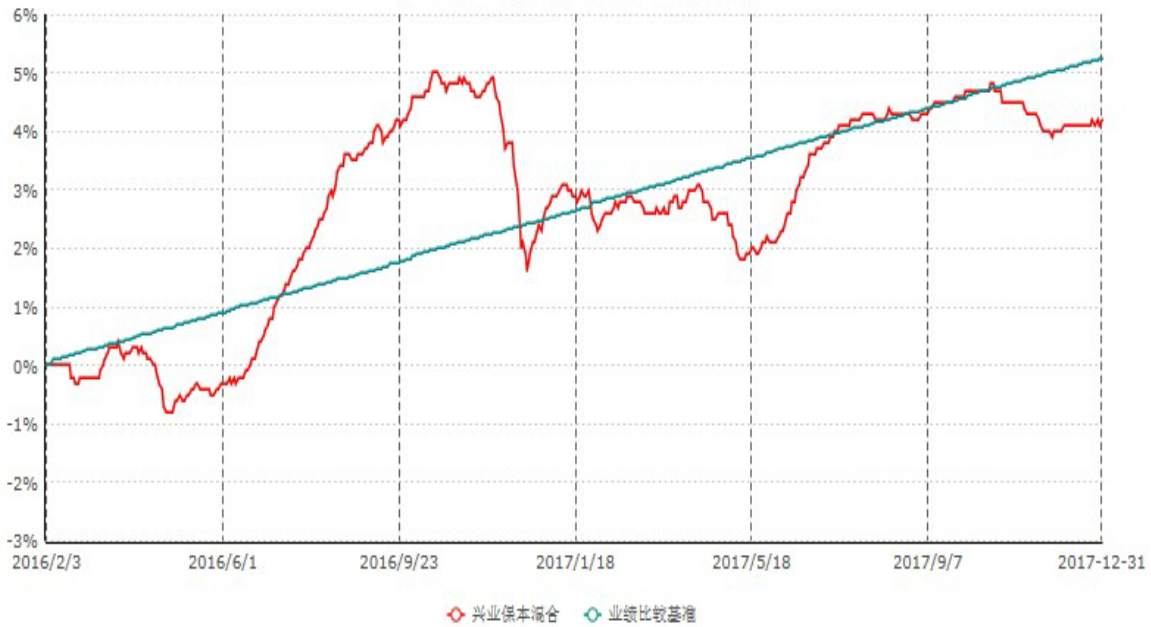
兴业保本混合型证券投资基金累计净值增长率与业绩比较基准收益率历史走势对比图 (2016年02月03日-2017年12月31日)