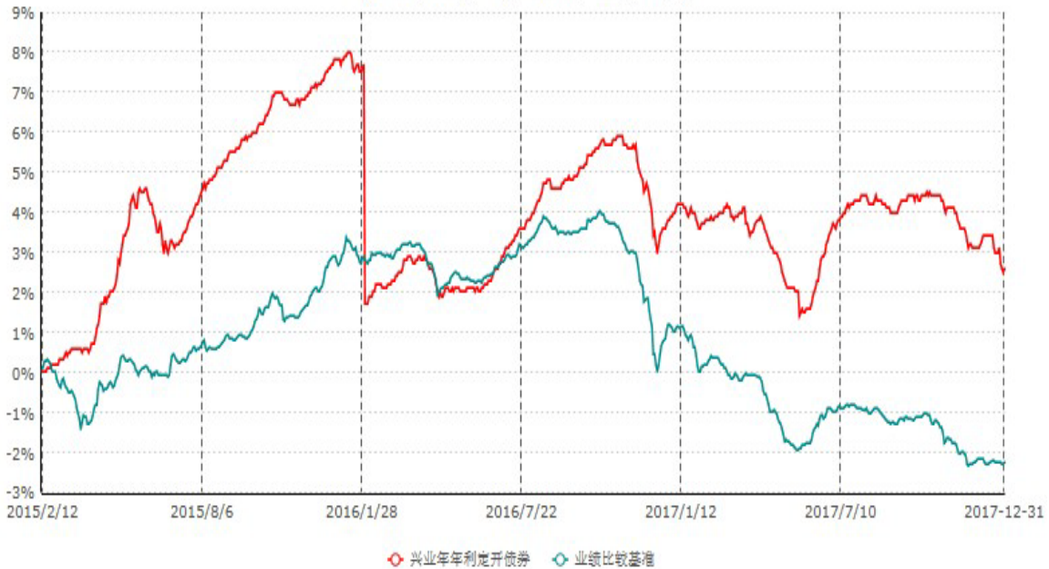
兴业年年利定期开放债券型证券投资基金累计净值增长率与业绩比较基准收益率历史走势对比图 (2015年02月12日-2017年12月31日)