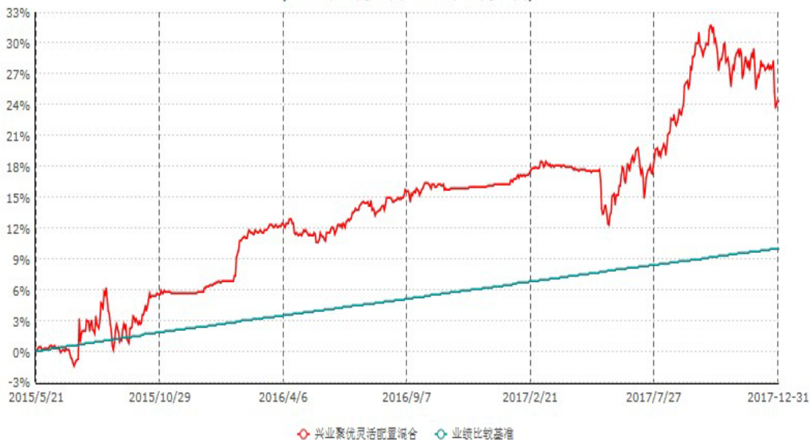
兴业聚优灵活配置混合型证券投资基金累计净值增长率与业绩比较基准收益率历史走势对比图 (2015年05月21日-2017年12月31日)