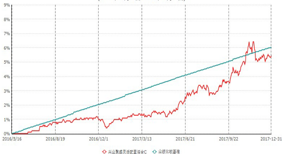
兴业聚盛灵活配置混合C累计净值增长率与业绩比较基准收益率历史走势对比图 (2016年05月16日-2017年12月31日)

注：1、根据本基金基金合同规定，本基金自基金合同生效之日起六个月内已使基金的投资组合比例符合基金合同的约定。 2、自 2016 年 5 月 16 日起，本基金分设两级基金份额：A 级基金份额和 C 级基金份额。详情参阅相关公告。