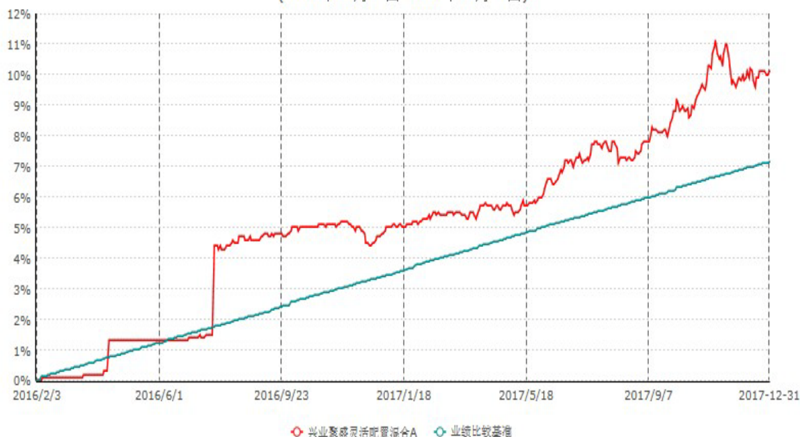
兴业聚盛灵活配置混合A累计净值增长率与业绩比较基准收益率历史走势对比图 (2016年02月03日-2017年12月31日)

注：1、根据本基金基金合同规定，本基金自基金合同生效之日起六个月内已使基金的投资组合比例符合基金合同的约定。 2、自 2016 年 5 月 16 日起，本基金分设两级基金份额：A 级基金份额和 C 级基金份额。详情参阅相关公告。