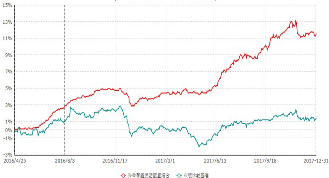
兴业聚鑫灵活配置混合型证券投资基金累计净值增长率与业绩比较基准收益率历史走势对比图 (2016年04月25日-2017年12月31日)