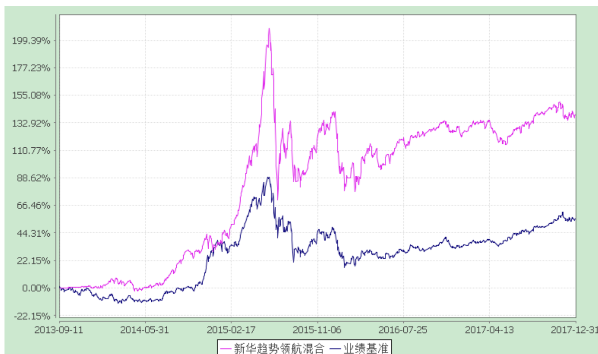
份额累计净值增长率与业绩比较基准收益率的历史走势对比图 (2013 年 9 月 11 日至 2017 年 12 月 31 日)