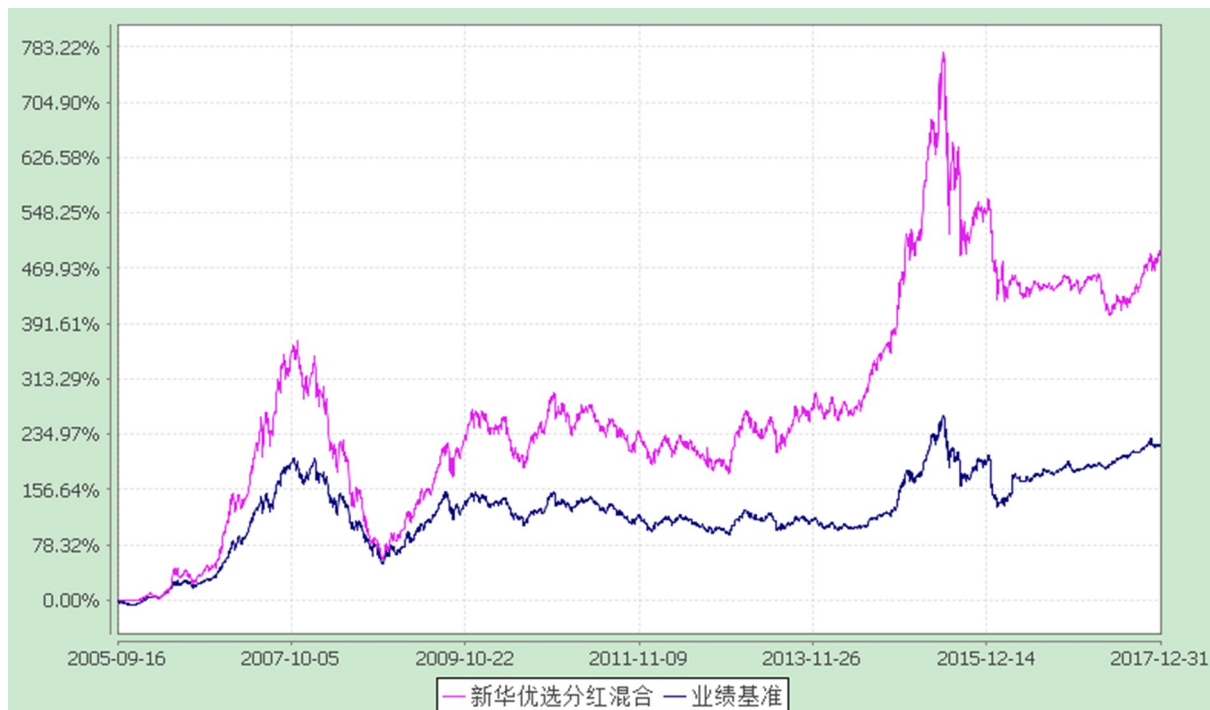
自基金合同生效以来份额累计净值增长率与业绩比较基准收益率的历史走势对比图 (2005 年 9 月 16 日至 2017 年 12 月 31 日)