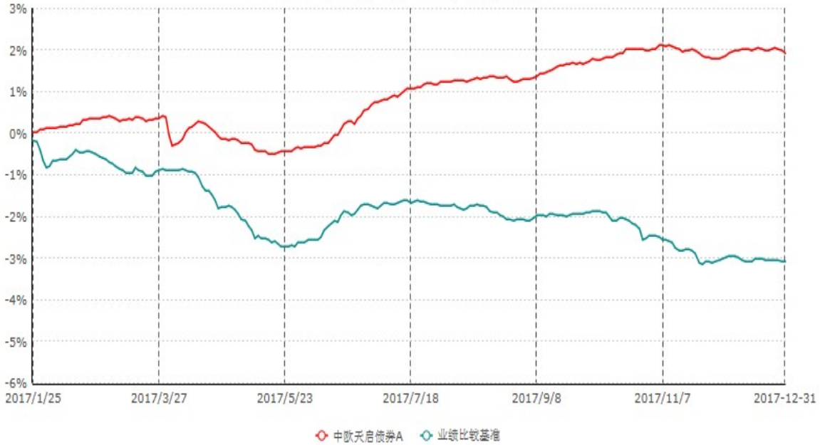
中欧天启债券A累计净值增长率与业绩比较基准收益率历史走势对比图 (2017年01月25日-2017年12月31日)

注：本基金基金合同生效日期为 2017 年 1 月 25 日，自基金合同生效日起到本报告期末不满一年，按基金合同的规定，本基金自基金合同生效起六个月为建仓期，建仓期结束时本基金的各项资产配置比例已达到基金合同的规定。