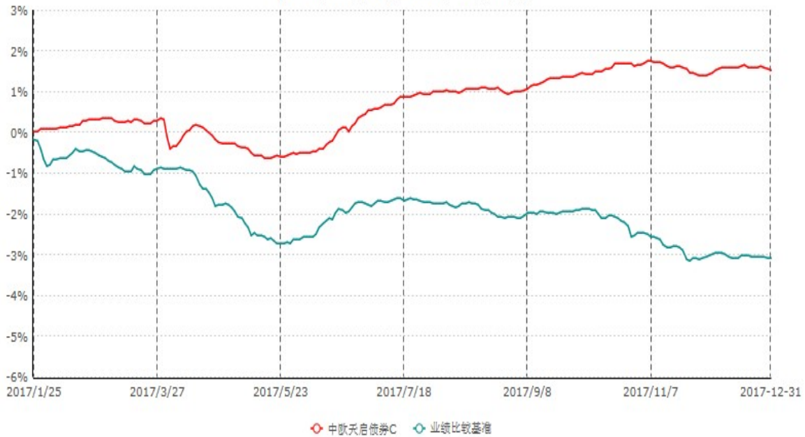
中欧天启债券C累计净值增长率与业绩比较基准收益率历史走势对比图 (2017年01月25日-2017年12月31日)

注：本基金基金合同生效日期为 2017 年 1 月 25 日，自基金合同生效日起到本报告期末不满一年，按基金合同的规定，本基金自基金合同生效起六个月为建仓期，建仓期结束时本基金的各项资产配置比例已达到基金合同的规定。