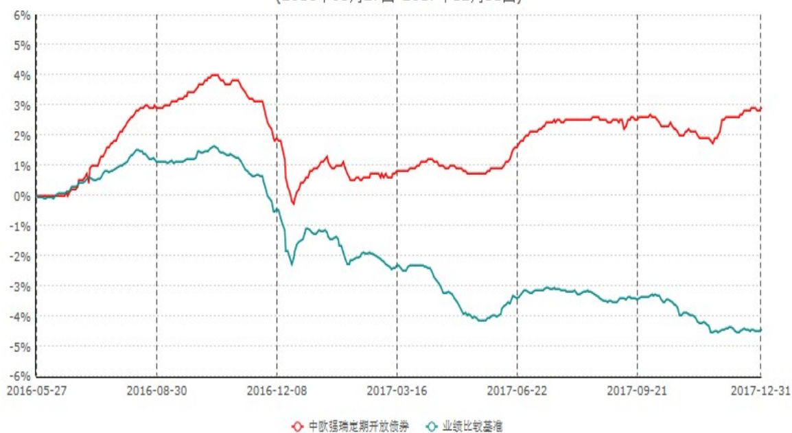
中欧强瑞多策略定期开放债券型证券投资基金累计净值增长率与业绩比较基准收益率历史走势对比图 (2016年05月27日-2017年12月31日)